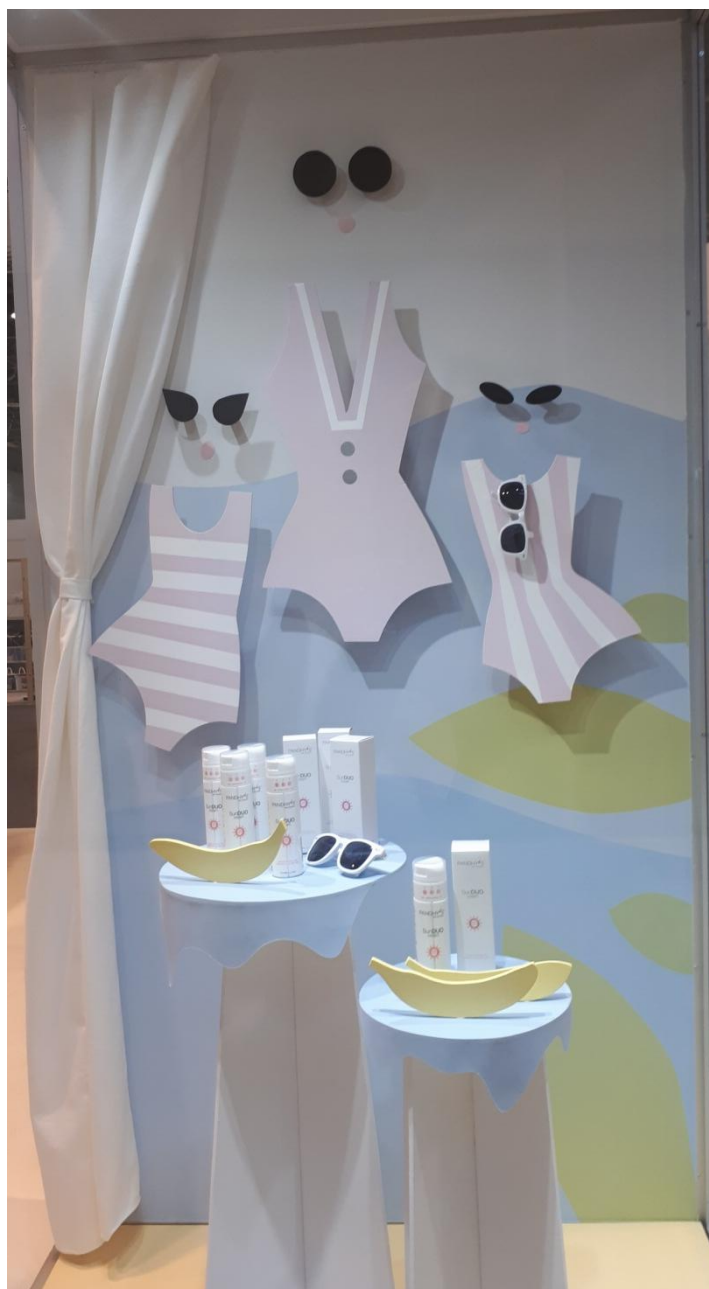
Образец Дизайн планшета