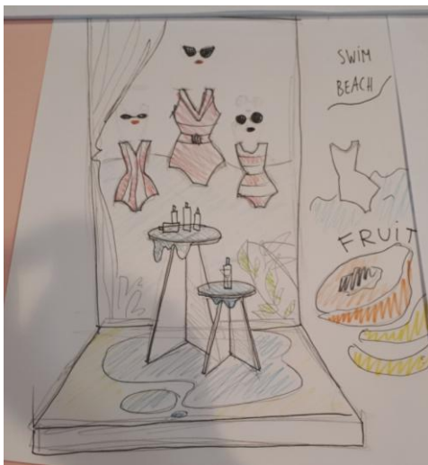
Образец обоснование дизайна, плана